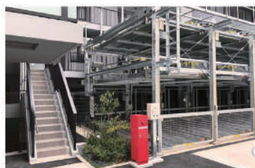
消火用歩廊（昇降用内上り梯子付き）